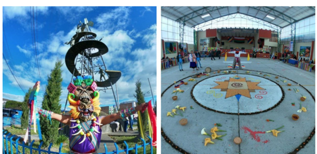
Figura 1. Ejercicio 1. Elaboración de relato que contenga tres momentos significativos: origen familiar y cultural, lengua, religión y/o cosmogonía.